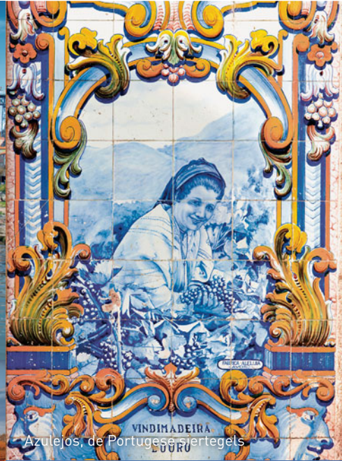
Azulejos de Portugese siertegels VINDIMADEIRA LÓURU