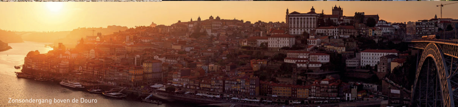
Zonsondergang boven de Douro