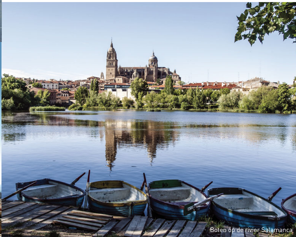
Boten op de rivier Salamanca