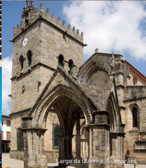
Largo da Gliveira, Guimarães