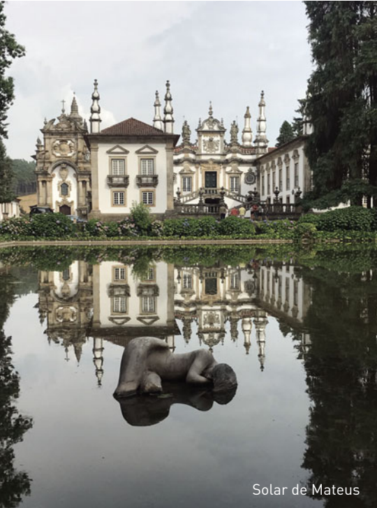
Solar de Mateus