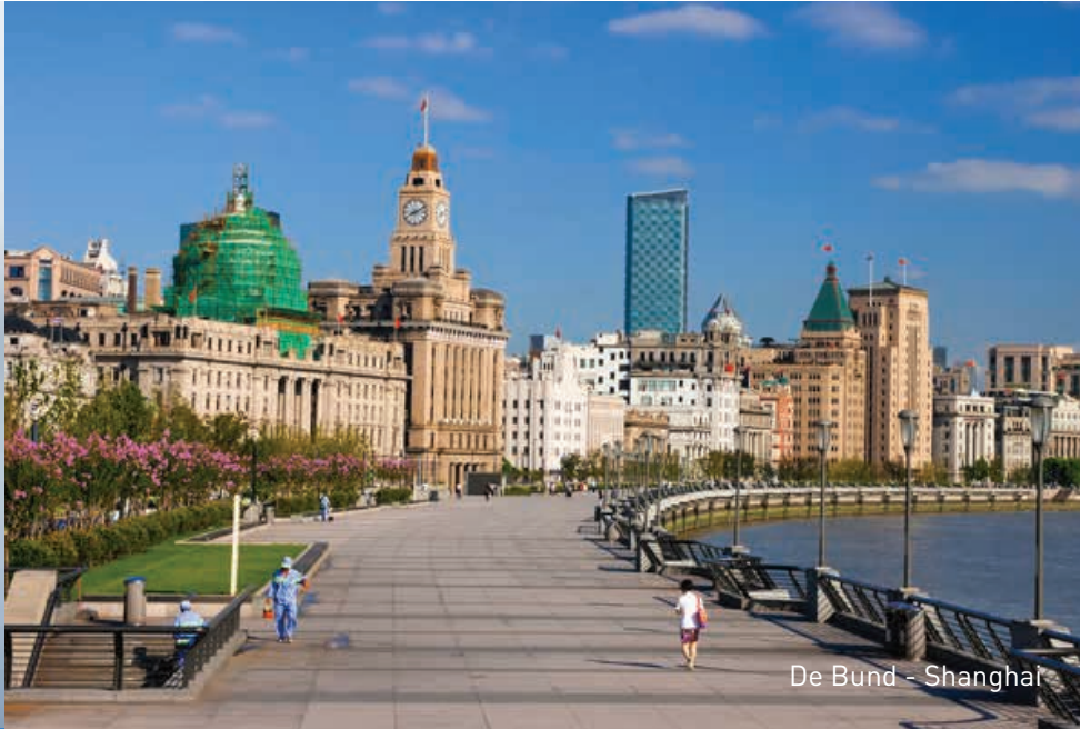
De Bund - Shanghai