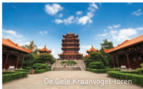
De Gele Kraanvogel-toren

De M/S Yangzi Explorer houdt halt in Wuhan. Deze agglomeratie is ontstaan uit een fusie van de steden Hankou en Wuchang en is de hoofdstad van de provincie Hubei. Deze stadsregio ligt bij de samenvloeiing van de Yangtze en de Han-rivier. Her en der zijn nog sporen te vinden van de westerse concessies uit de 19de eeuw. We bezoeken er het Hubei